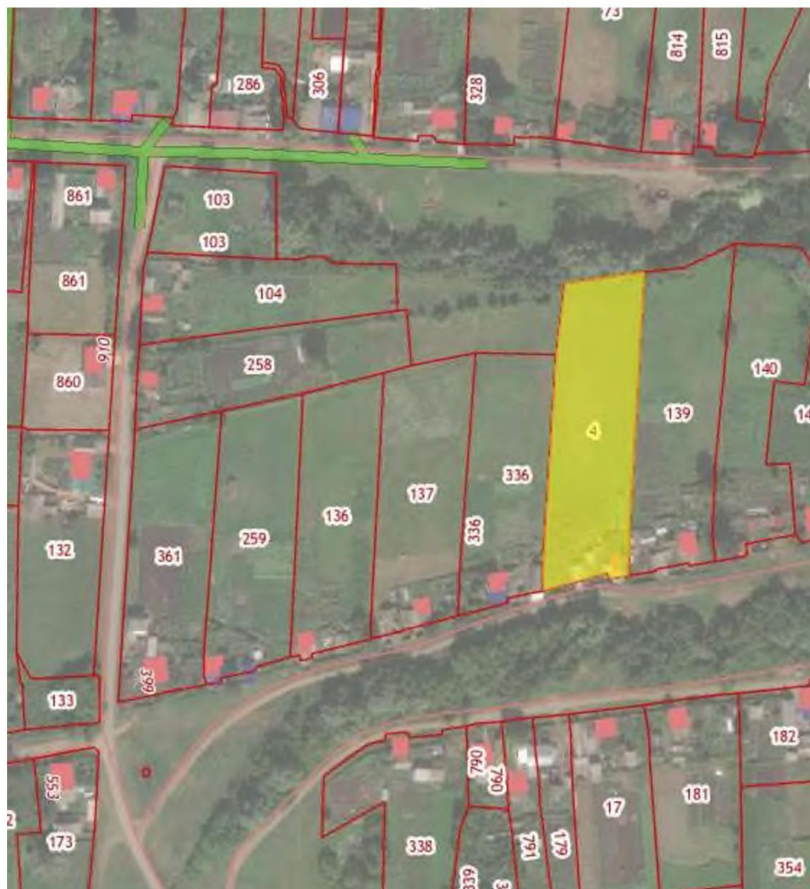
Выкопировка из публичной кадастровой карты